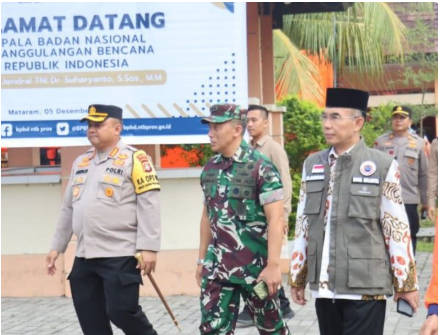
Kapolresta Mataram (Kiri) saat menghadiri acara Peletakan batu Pertama pembangunan gedung Pusdalops BPBD NTB, Kamis (05/12/2024)