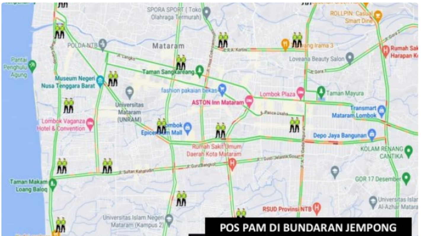
Personel yang Disiagakan pada Pos Pengamanan dan Pos Penyekatan, (04/11)

Mataram NTB - Mendukung terselenggaranya event Internasional Word Superbike (WSBK) Mandalika 2022 berlangsung sukses, ribuan personel akan disiagakan di dalam wilayah pulau Lombok, untuk itu para penonton tidak perlu khawatir.